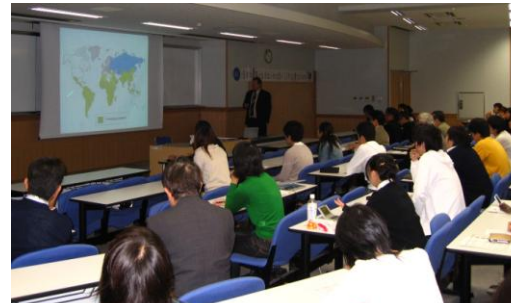
フォーラムの様子

10月29日(月)水戸キャンパスインタビュースタジオにてサステナフォーラムを開催しました。講師には今年のノーベル賞受賞機関IPCCのメンバーであるジョン・ハイ氏、パトリック・ナン氏をはじめ、4名の著名な外国人教授を迎え約3時間に渡り大いに盛り上がりました。